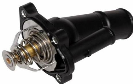
Рис. 1. Термостат

ет его замены. Цель данной работы состоит в определении оптимальной периодичности по замене термостата методом определения оптимальной периодичности по допустимому уровню безотказности. Объектом разработки является термостат автомобиля Ford Focus (рис. 1).